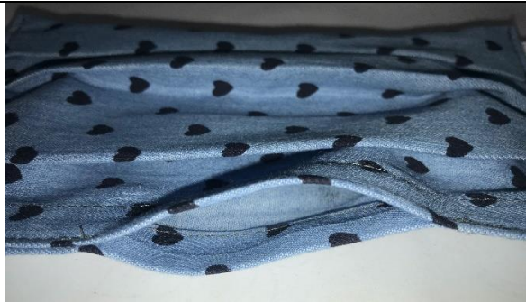
17.so entsteht an der unteren Kante eine Öffnung – zusätzlich für ein Taschentuch zum Hineingeben