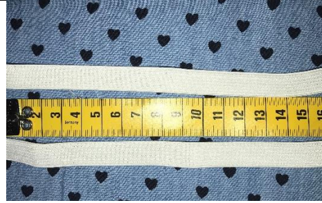
8. 2 Gummibänder – je nach Kopfgröße, 16 – 18 – 20 – 22 cm