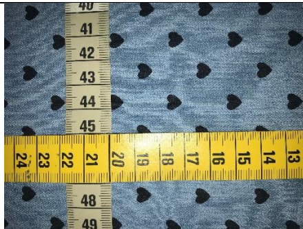
1. Zuschnitt: 45 x 20