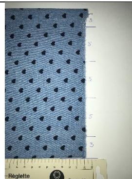
4. Bezeichnung: bei 3-5-5-5-3cm markieren