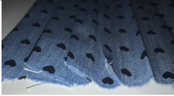
7. Falten einbügeln – von der Mitte in Richtung Kante bügeln!