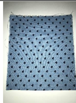
2. In die 1/2 bügeln (22,5 x 20)