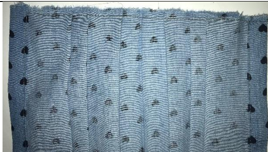
11. andere Seite genauso arbeiten