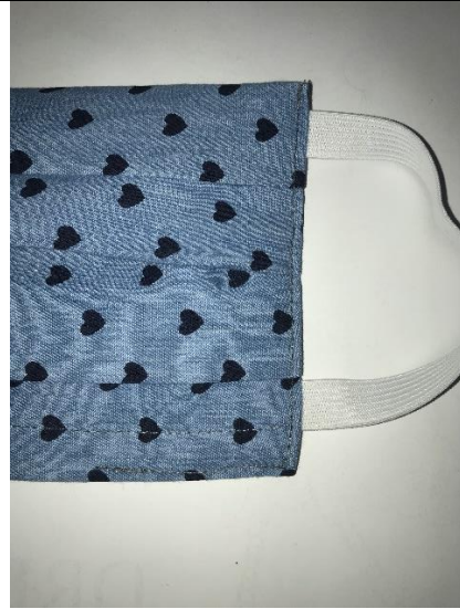
16.So bleibt die Maske auch nach dem Waschen in Form!