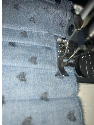
10. drehen – Falten fixieren