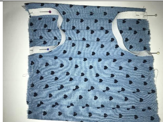
12. wenden und Gummiband anstecken – knapp ober der Hälfte und am Rand