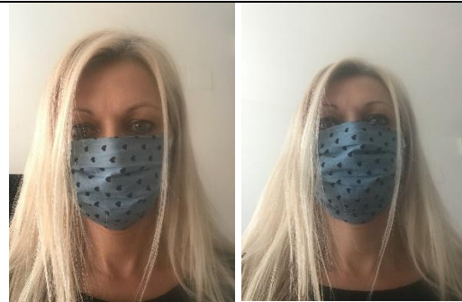
18.durch die Falten auf jeder Seite lässt sich die Mundschutzmaske bis über das Kinn ziehen