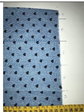
6. an den „5-er“ Zwickeln 3x Bug einbügeln