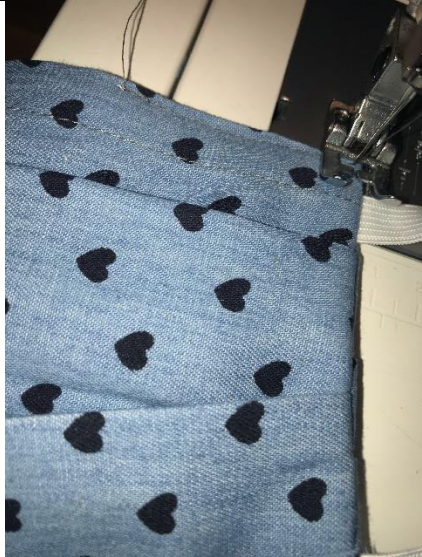
15.Kante ca 5 cm absteppen – drehen – Seitennaht absteppen