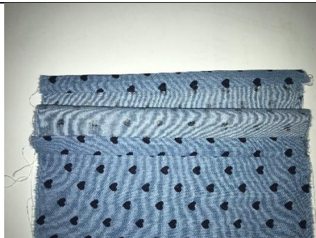
3. Saum umbügeln