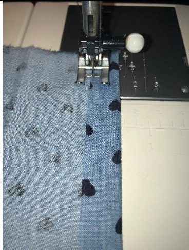
9. Saum kantig steppen