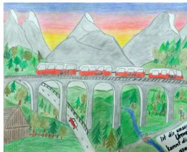
Platz 2: Julia Weißinger SMS Zwettl