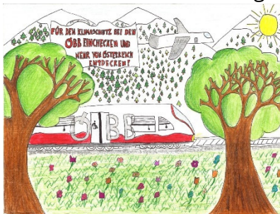
Platz 1: Marlene Mitmasser Stiftsgymnasium Melk