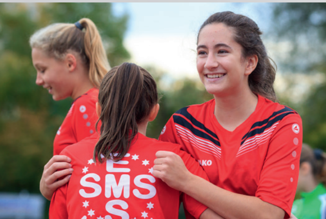
Laufen macht Spaß