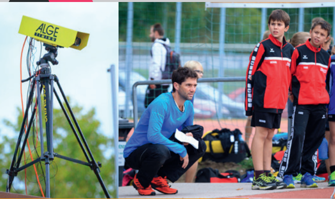
Alles im Blick