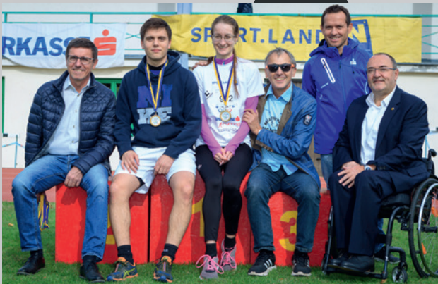
Gold fühlt sich gut an