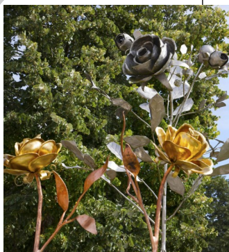
Europäische Friedens- rose Waldhausen

und wo es was zu heilen gibt, jede Hand.